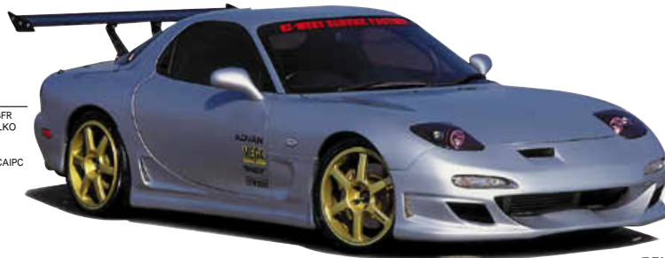
フロントバンパーII