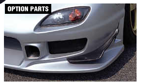
OPTION PARTS フロントカナードII(PPCC製) ¥21,000 品番: CFD04B-FCPC N1フロントバンパーII専用 エアダクトII(PCC製) ¥18,900 品番: CFD04B-ADPC N1フロントバンパーII専用