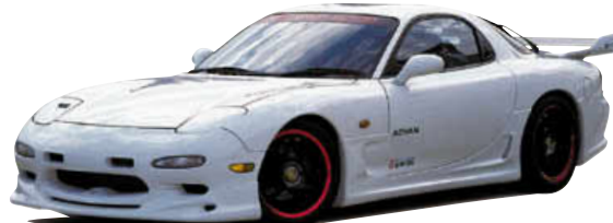
フロントハーフスポイラー