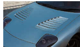
スーパーエアロボンネット(FRP製) ¥134,400 品番: CFD03B-ABFR