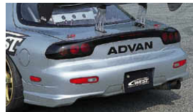
リアバンパーII (FRP製) ¥63,000 品番: CFD04B-RBFR リアバンパーII (PFRP製) ¥67,200 品番: CFD04B-RBPF