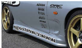
サイドステップIII (FRP製) ¥56,700 品番: CFD04B-SSFR サイドステップIII (PFRP製) ¥60,900 品番: CFD04B-SSPF