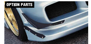
OPTION PARTS フロントカナード(CFRP製) ¥21,000 品番: CFD03B-FCCF N1フロントバンパーII専用

N1フロントバンパーII 写真N1フロントバンパーII装着のフロントカナード、エアダクト、 アンダーパネルIIはバンパー注文時のオプションとなります。