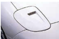
フロントエアインテーク(ウレタン製) ¥12,600 品番: CFD01A-FAIPU