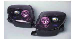
ライトキット ¥144,900 品番: CFD01A-LKO 保安基準適合外