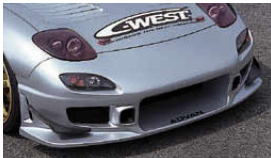
N1フロントバンパーII (FRP製) ¥77,700 品番: CFD04B-FBFR N1フロントバンパーII (PFRP製) ¥81,900 品番: CFD04B-FBPF