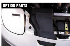
OPTION PARTS クールエアインテーク(PCC製) ¥29,400 品番: CFD02B-CAIPC フロントバンパーII専用