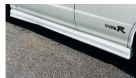
□サイドステップ (FRP製) (4Dr) ¥39,900 品番: CDC201A-SS4FR ■サイドステップ (PFRP製) (4Dr) ¥44,100 品番: CDC201A-SS4PF