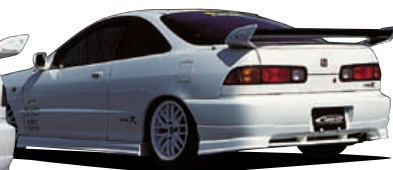
□リアハーフスポイラー ('96スベック用) (2Dr)