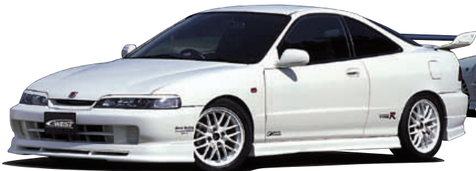
□フロントハーフスポイラー