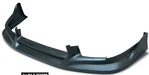
for B4 & WAGON