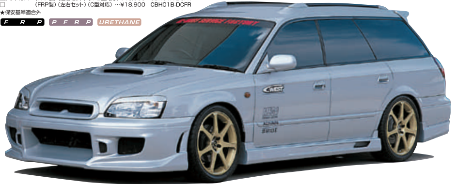
フロントバンパー (A・B型対応) (C型対応)