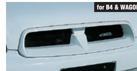
for B4 & WAGON