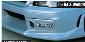
for B4 & WAGON