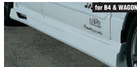
for B4 & WAGON