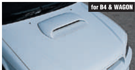
for B4 & WAGON