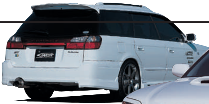
リアアンダーフィン (A・B・C型対応) (D型対応)