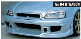
for B4 & WAGON