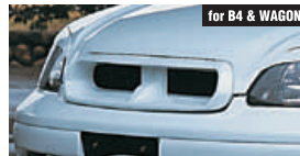
for B4 & WAGON