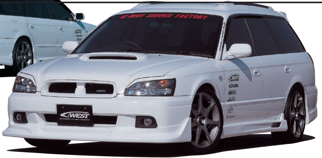
フロントハーフスポイラー (A・B型対応) (C型対応) (D型対応) ※写真のエンブレムは別売です。