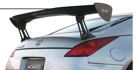
□FAIRLADY Z Z33 (専用設計)