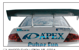
□LANCER EVOLUTION.VII CT9A