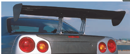
□SKYLINE GT-R BNR34