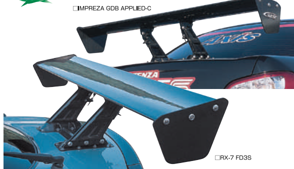
□IMPREZA GDB APPLIED-C

2003 オールジャパン ジムカーナチャンピオンシップ A-4クラス チャンピオン!! AXIS RE55S IMPREZA