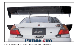
□LANCER EVOLUTION.VI CP9A