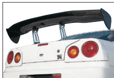
□SKYLINE GT-R BNR34