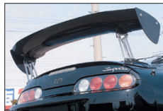
□SUPRA JZA80 (専用設計)