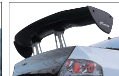
□LANCER EVOLUTION.VII CT9A