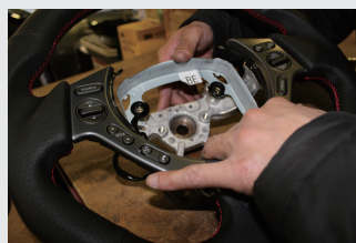
14 製品に逆の手順で組み込んでいく