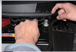
2 エアバックの誤爆を防ぐ為に、バッテリーのマイナス端子を外し、10~15分程度放電します。