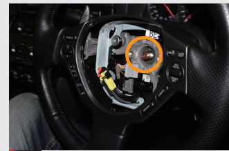
9 ステアリングロッドとボスに"センター"を表すマーキングを確認しておく。