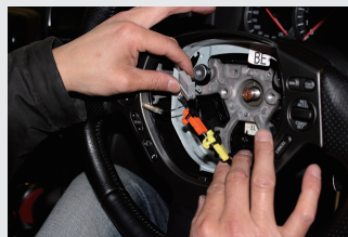
8 ステアリングSW類やホーンカブラーを外す。