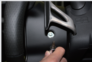
4 T30のトルクスレンチで同2カ所のボルトを外す。(注意:トルクスの中央に穴が開いたタイプが必要。)