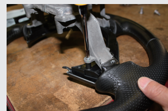
12 プラスドライバーでステアリングSWパネルを外す。