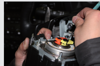
6 エアバック作動センサーのカブラーを薄めのマイナスドライバーで外す。(折れないように注意して下さい。)