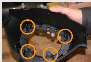
11 4カ所のツメを広げコラム後方のカバーを外した状態