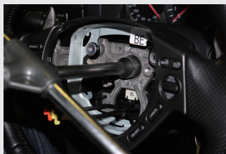
7 十字レンチでボスナットを外す。