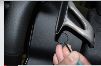
3 ステアリングコラムにあるキャップ2個を薄めのマイナスドライバーでめくる。