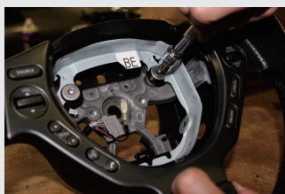
10 T30トルクスレンチでエアバック兼ホーン土台を外す。