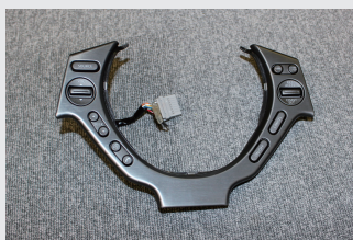
13 SWパネルが外された状態